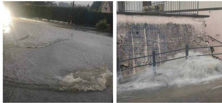
Les éléments se sont déchaînés et on a eu droit à des scènes impressionnantes.

Outre la crise sanitaire, la commune de Dasle connaît actuellement une autre catastrophe, les inondations.