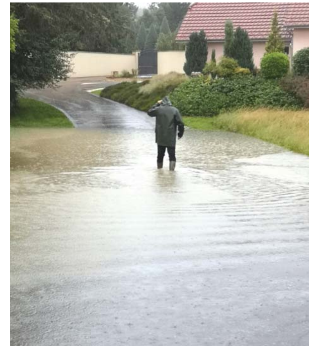
Une photo-symbole de ce qu'a connu Dasle en juin...