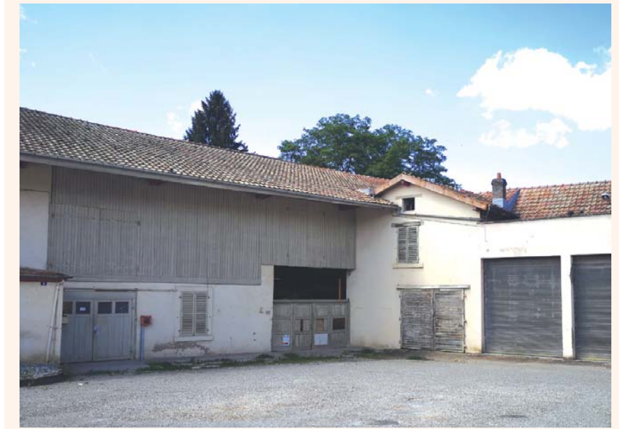
La ferme Heynen va disparaître du paysage dans quelque temps.

Les nouveaux élus ont repris le dossier de l'aménagement de la place Espace-Loisirs qui comprend la démolition de la ferme Heynen. Il s'agit là de l'une des opérations majeures de ce début de mandat. Ils ont d'ores et déjà apporté quelques modifications à ce projet (notamment la réalisation d'une aire de jeux pour enfants) qui, selon la volonté du Maire Carole Thouesny, se fera en collaboration avec les habitants.