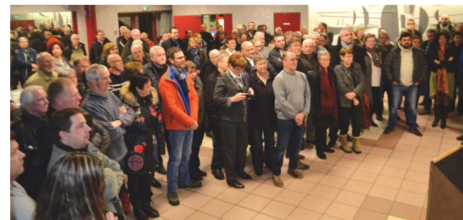
Une nombreuse assemblée a pris part à la cérémonie des vœux de la Municipalité.