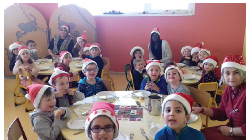
Concours de bonnets de Père Noël à l'occasion de ce repas de fêtes !

Le 15 décembre dernier, 112 élèves ont eu droit à un menu de fêtes peu avant les vacances scolaires : aigillettes de poulet au comté, pommes croquettes, pavé Val de Saône, sapin de Noël et chocolats de Noël. Un concours de bonnets de Père Noël a été