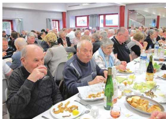
Après avoir organisé une friture le 7 février...

Toujours aussi actifs, les Saute-Boyets ont organisé deux repas ces derniers temps : le 7 février, ils étaient 135 pour le repas-friture qui a donné lieu à un beau moment de convivialité animé par des chants. Quelques semaines plus tard, 85 membres se sont retrouvés pour le repas-cramailots. Bien sûr, les cramailots ont été servis en com-