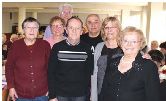
... les Saute-Boyets ont proposé un repas-cramailots en mars.

plément d'un succulent baeckeoffe, des chocolats de Pâques venant tout naturellement égayer le desserts. Outre leurs rencontres mensuelles, les Saute-Boyets ont d'ores et déjà inscrit à leur agenda une escapade avec dîner-spectacle au Cabaret Le Belcour à Saint-Nabord, du côté de Remiremont.