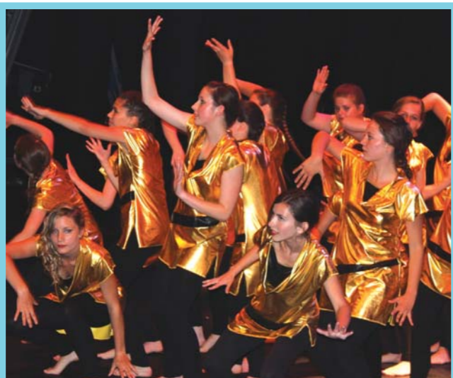
Le gala des NAD a recueilli son succès coutumier.