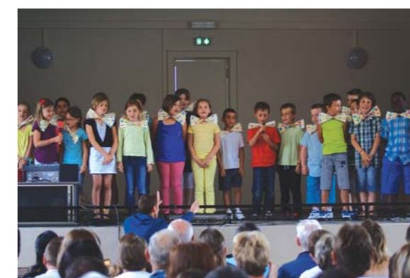
Le spectacle du matin a fait salle comble...

Comme chaque année, la fin de l'année scolaire a été marquée par une grande fête. Le matin, la salle protestante était bondée pour le traditionnel spectacle proposé par les enfants. Cette fête s'est poursuivie l'après-midi par la kermesse suivie d'un barbecue organisés à l'école par l'association des parents d'élèves.