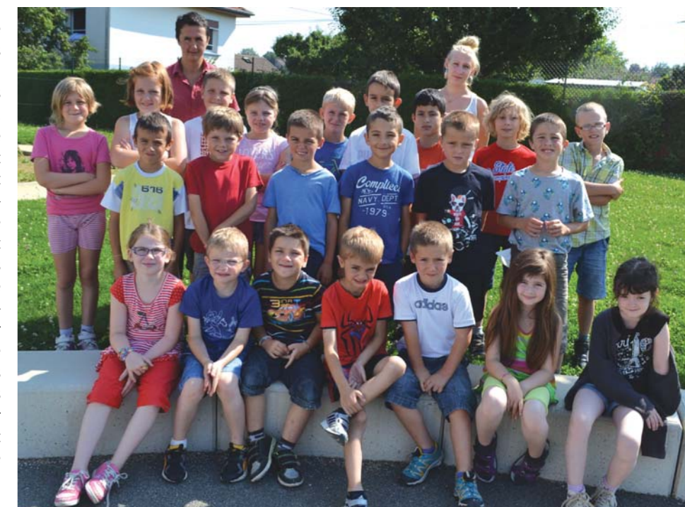
Le Centre de Loisirs, une bonne occupation pour le mois de juillet !