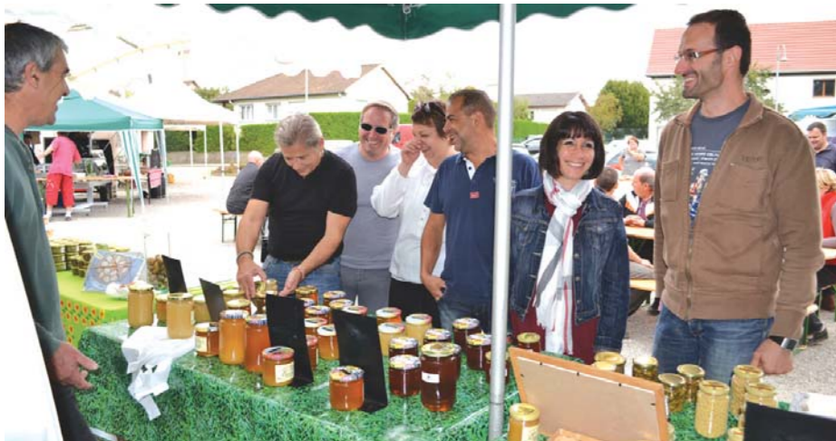
A la découverte des produits du terroir.