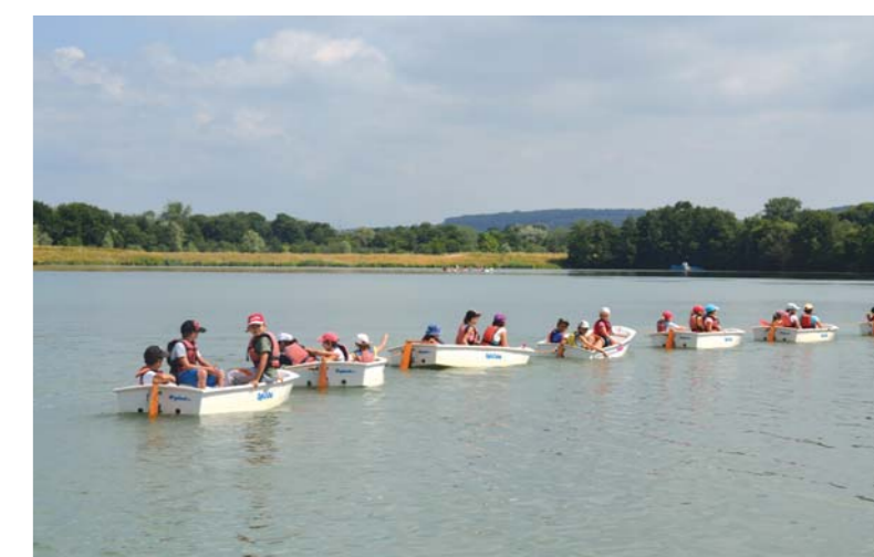
Une expérience intéressante pour les écoliers.