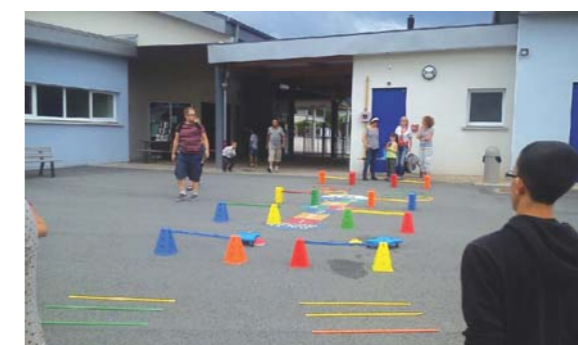
...la fête s'est poursuivie à l'école par la kermesse.

Comme chaque année, la fin de l'année scolaire a été marquée par une grande fête. Le matin, la salle protestante était bondée pour le traditionnel spectacle proposé par les enfants. Cette fête s'est poursuivie l'après-midi par la kermesse suivie d'un barbecue organisés à l'école par l'association des parents d'élèves.