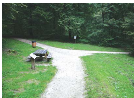
Une nouvelle jeunesse pour le sentier.

Datant de quinze ans déjà, très fréquenté tout au long de l'année et en particulier aux beaux jours, le sentier de promenade a tout naturellement souffert du temps qui passe. C'est la raison pour laquelle il a fait récemment l'objet de quelques travaux : des portions de chemin ont été rénovées pour le plus grand plaisir des utilisateurs.