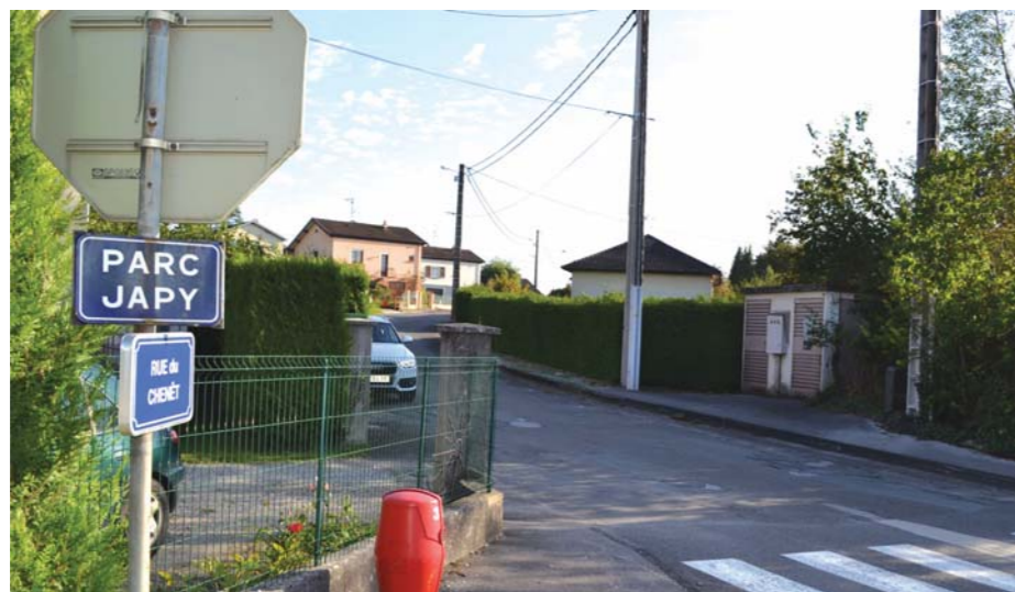
L'entrée du Parc Japy qui va faire l'objet de travaux de voirie importants.

Dans un premier temps, le cabinet devra définir les aménagements nécessaires pour remédier aux dysfonctionnements constatés (qualité des voiries, voirie de desserte, problèmes d'écoulement des eaux pluviales,...). Plusieurs solutions d'aménagements devront être présentées à la commune afin de permettre aux élus de faire un choix en fonction des impératifs et des disponibilités budgétaires, sachant que les priorités suivantes ont été définies : - reprise de la couche de roulement des voiries, - prise en compte de la norme sur l'accessibilité dans l'ensemble des aménagements, - mise en œuvre d'aménagements spécifiques permettant de limiter la vitesse et le transit par les voies internes au quartier, - enfouissement éventuel de l'ensemble des réseaux secs, - redimensionnement du réseau d'eau pluvial par la réalisation